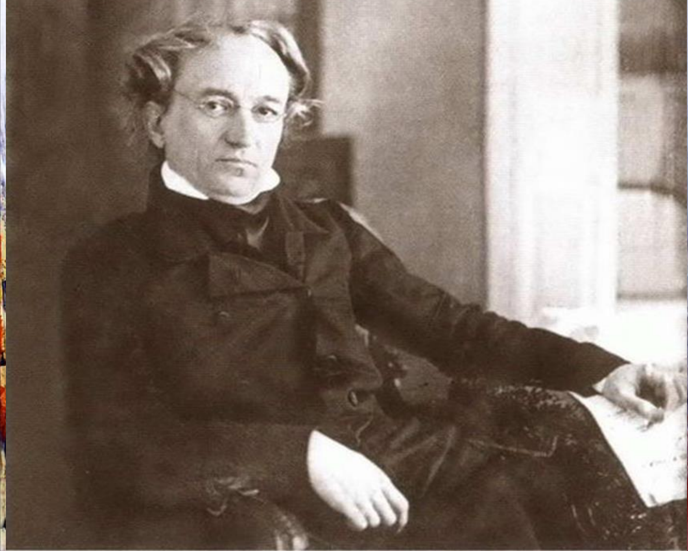
Федор Иванович Тютчев.