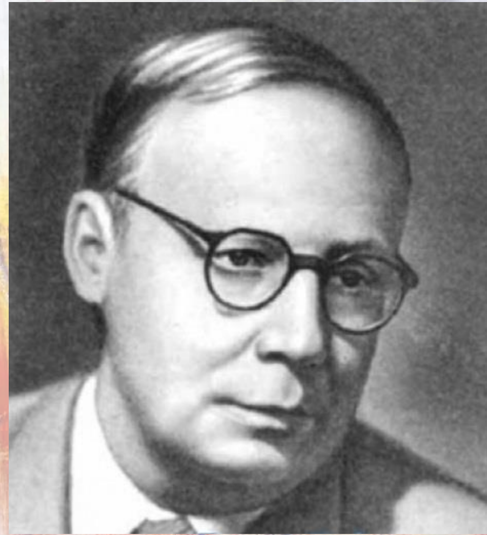
Николай Алексеевич Заболоцкий

Гроза у Заболоцкого – символ мистического акта: напряжения всех сил, концентрации всех энергий в преддверии созидания нового, сотворения красоты. Этот мистически акт пугает и манит одновременно, он непостижим рационально, но он часть законов земного мира. Подчинение ему дает ни с чем не сравнимое счастье – ощутить божественное в себе, почувствовать себя творцом, уподобиться высшему. Образ создаваемой в мире красоты олицетворён в образе «светлоокой девы» – богини красоты, естества жизни, чистоты Афродиты.